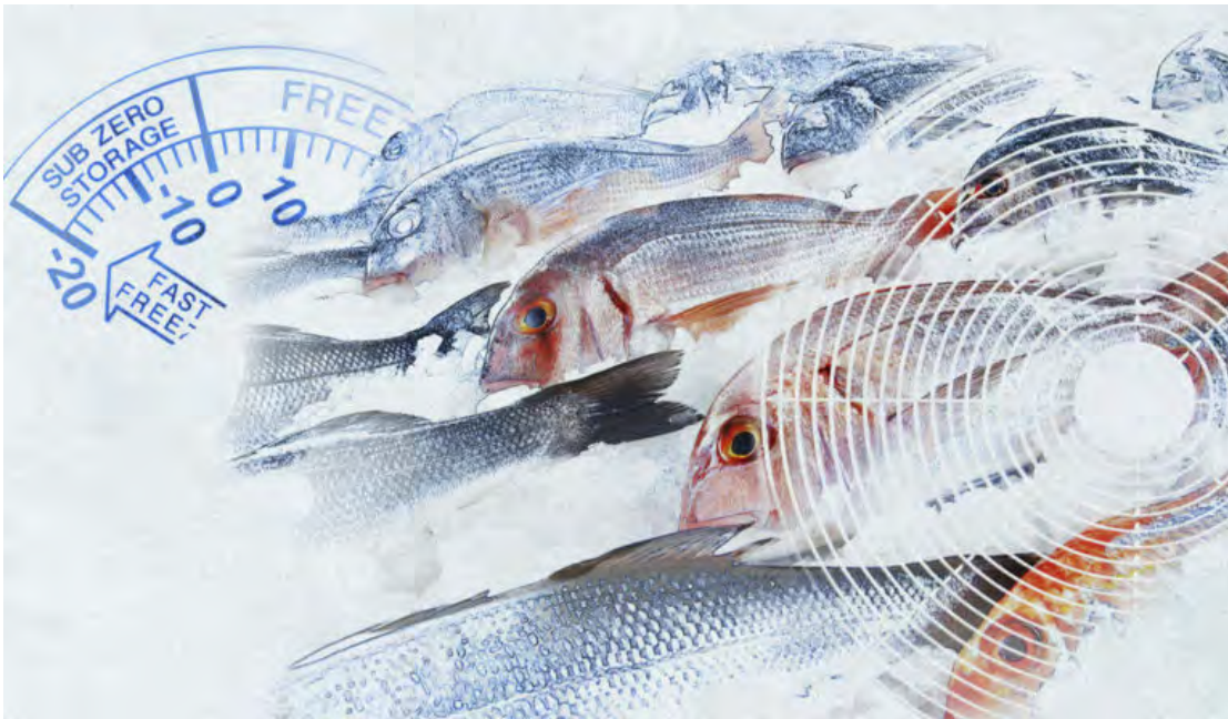
Торговое холодильное оборудование