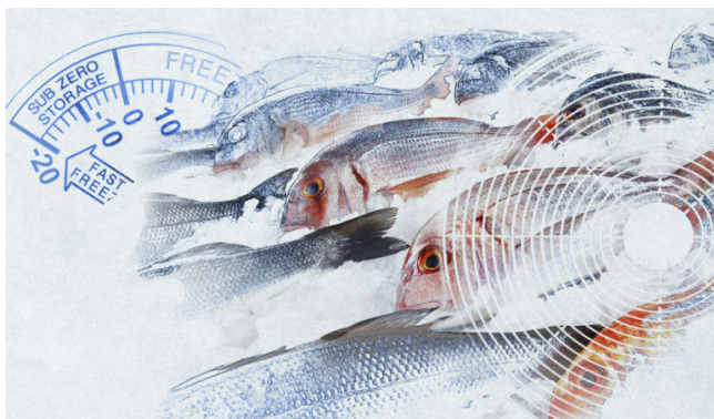
Торговое холодильное оборудование